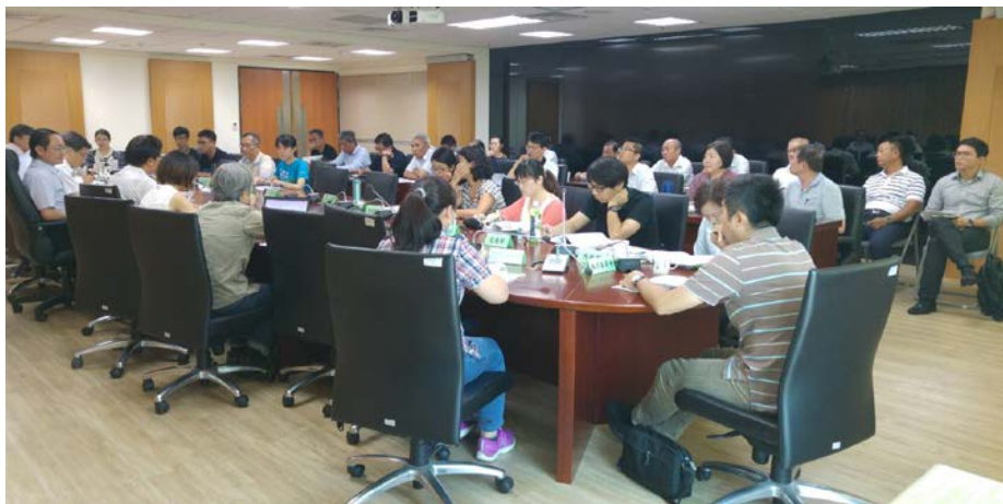
本會代表出席「境外僱用漁工勞動權益小組」第三次會議

幸得最後會議決議，就目前境外僱用船員納入勞基法一案，尚有許多衝突、不適用之處，仍不應適用。另有關船員薪資部份，會議中仍維持目前法規之規定，不予調漲，但須落實船員薪資之給付。為維護我們漁民的基本生活權益，保障我們漁民之工作權，未來本會將與各單位持續溝通，以維持產業的正常發展。本會將持續關注此議題，並且反駁部分團體利用假新聞來抹黑漁民的形象。